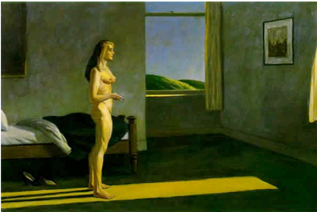
Una Mujer al Sol (1961)

Avanzar y estructurar, es elegir un tema de trabajo. Hemos tomado como referencia la obra del pintor americano Edward Hopper (1882-1967). Espacios luminosos muy recortados, la localización de los personajes en la luz, su mirada atraída hacia ésta, como el reflejo de otro mundo.